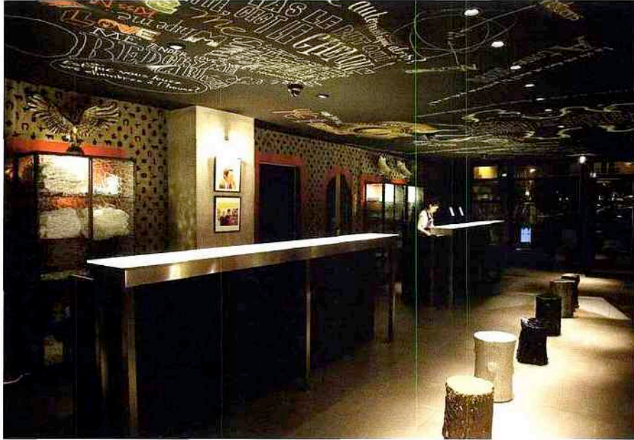
L'hôtel Le Mama Shelter, architecture intérieure Philippe Starck