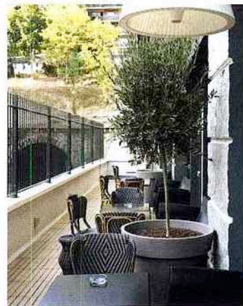
La terrasse et le restaurant du Mama Shelter