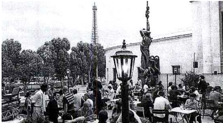
Siroter un verre au FL, face à la dame de fer

Cet été, à Paris et en Ile-de-France, les longues soirées seront animées : concerts, cinéma, clubbing, terrasses à la fraîche, bals... Le Figaroscope a sélectionné les meilleures sorties à la belle étoile.