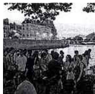
Le BBQ électro de Dcontract