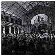
Ciné karaoké géant et bal au Centquatre pour la clôture de Paris Cinema