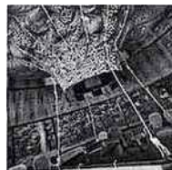
Prendre un thé dans l'hôtel Saint James

Pour une fête nationale sexy et décalée, direction